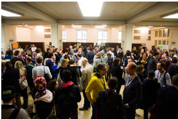
Besucher 2013