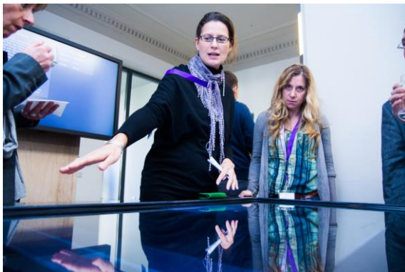
Exponat 2013: SimMed (Archimedes Exhibitions, Berlin)

Am World Usability Day wird weltweit mit unterschiedlichen Aktionen auf das Thema Usability und User Experience aufmerksam gemacht. Zuletzt hatte der World Usability Day über 40.000 Besucher auf 140 Veranstaltungen in 44 Ländern angezogen. Dieses Jahr findet der World Usability Day bereits zum zehnten Mal statt! Die Veranstaltung ist für die Besucher kostenfrei.