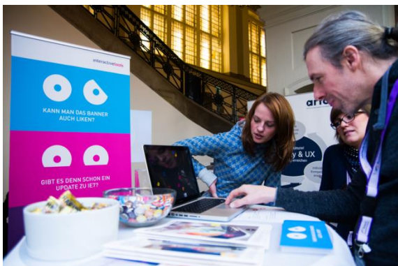
Sponsorenstand 2013

Welche neuen Möglichkeiten für Zusammenarbeit, Teilhabe und Engagement bieten Communities im Internet? Was inspiriert NutzerInnen, sich gesellschaftlich, für andere oder für ein bestimmtes Thema zu engagieren? Ermöglicht gute Usability mehr und wirkungsvolleres Engagement?