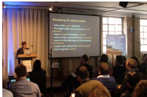
Keynote 2012: K. Tzanidou, Google London

Die sehr hohe Zufriedenheit der Teilnehmer und Unterstützer des World Usability Days Berlin zeigt, dass Sie als Sponsor in ein hochkarätiges Event investieren, das Ihnen eine gezielte Ansprache von Entscheidern aus Unternehmen und exzellentes Networking an einem außergewöhnlichen Veranstaltungsort garantiert. Sehr gerne beraten und betreuen wir Sie als Sponsor des World Usability Day Berlin 2014!