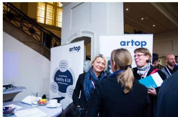
Sponsorenstand 2013