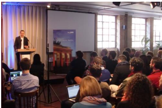
Grußwort 2012: Staatssekretär N. Zimmer