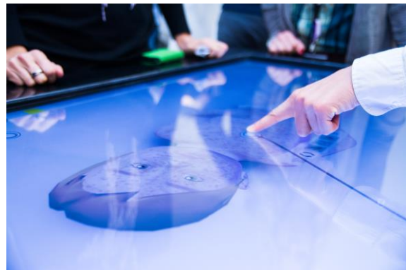
Exponat 2013: SimMed (Archimedes Exhibitions, Berlin)