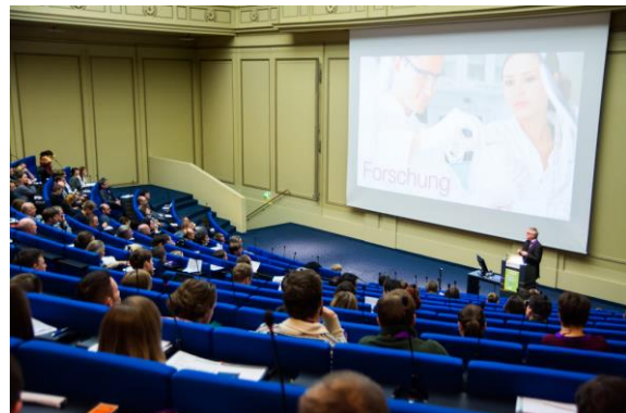
Vortragssaal 2013

Der World Usability Day in Berlin wird von der German UPA gemeinsam mit regionalen Vertretern aus Wirtschaft und Forschung veranstaltet. Unsere Themen der vergangenen Jahre waren: Usability im Web 2.0 (2008), Probefahrt Usability - Profis und ihre Methoden erleben (2009), Mobile Communication (2010), Social Networks (2011), Digitales Bezahlen & Service-Design (2012) mit über 400 Besuchern, Designing for Health (2013) mit dem bisherigen Besucherrekord von 600 Besuchern. Von diesen 600 Besuchern waren 35 % Inhouse Professionals aus unterschiedlichen Bereichen, 35 % arbeiteten in Agenturen und 30 % der Besucher waren dem Hochschulbereich zuzuordnen.